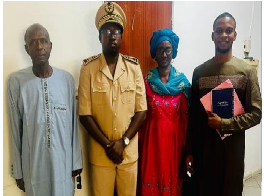
Mission d'information du projet à Sédhiou et rencontre avec l'Adjoint Gouverneur et les OSC/OCB

A travers le financement du gouvernement Luxembourgeois, AcDev met en œuvre un important projet de plaidoyer pour promouvoir la santé et le bien-être des adolescents et jeunes au Sénégal. Ce projet est mis en œuvre dans quatre régions du Sénégal (Dakar, Saint-Louis, Matam et Sédhiou). Le lancement du projet est marqué par des missions d'information à Matam, Sédhiou et Saint-Louis à la rencontre des représentants de l'Etat, des services déconcentrés des associations intervenant dans le domaine de la santé et le bien-être des adolescents et jeunes. La démarche a été fortement appréciée par les différentes autorités qui affirment leur engagement à accompagner le projet durant tout le processus.