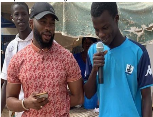
Micro-trottoir sur les connaissances en SR par le MAJ de Yeumbeul

A travers ses trois (3) espaces conseils pour adolescents, le personnel en collaboration avec les jeunes MAJ de AcDev ont mis en œuvre des stratégies pour renforcer la santé reproductive de leurs pairs. C'est le cas des activités de micros trottoir dans la banlieue de Yeumbeul, des cinés débats sur la sexualité précoce, des journées de consultations gratuites à Pikine, et des communications pour le changement de comportement à Louga.