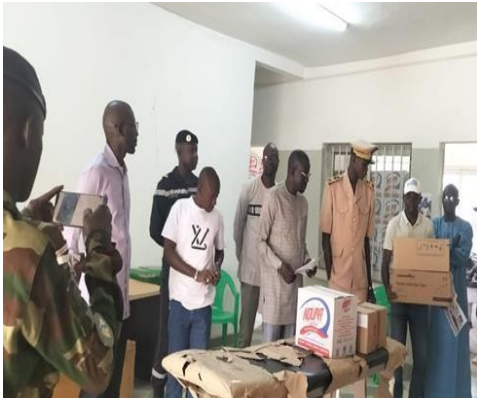
Remise de dons à la direction régionale de la santé pour les populations impactées par les inondations à Matam