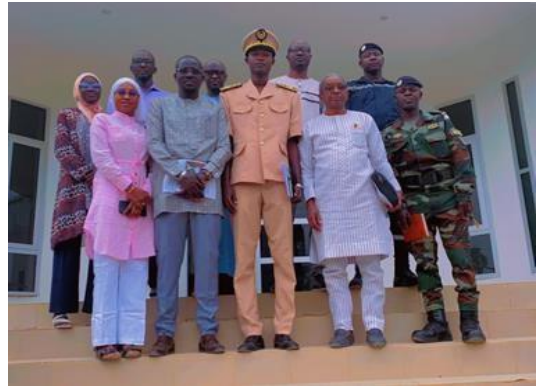
Mission d'information du projet à Matam et rencontre avec l'Adjoint Gouverneur, le DRS et les forces armées

Dans les prochaines étapes, des comités régionaux de plaidoyer multisectoriel seront mis en place sous la présidence du Gouverneur de région et au niveau national (Dakar), un bureau présidé par le Directeur de la Santé de la Mère et de l'Enfant sera constitué.