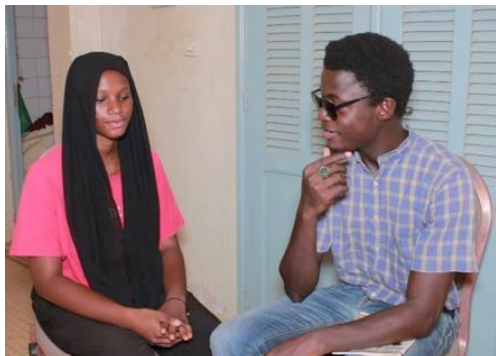
Activité de ciné-débat dans l'ECA de Pikine sur la santé reproductive

A travers ses trois (3) espaces conseils pour adolescents, le personnel en collaboration avec les jeunes MAJ de AcDev ont mis en œuvre des stratégies pour renforcer la santé reproductive de leurs pairs. C'est le cas des activités de micros trottoir dans la banlieue de Yeumbeul, des cinés débats sur la sexualité précoce, des journées de consultations gratuites à Pikine, et des communications pour le changement de comportement à Louga.