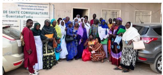
Formation Bajénou Gox et relais communautaires sur la prise en charge de la malnutrition chez les enfants 0-59 mois à Dakar

Des thématiques comme la nutrition adéquate, les signes de malnutrition, les soins de santé primaires, ainsi que des méthodes de sensibilisation des familles ont été abordées.