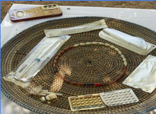
Activité de sensibilisation à Bambey sur les différentes méthodes de PF

Le mois de décembre 2024 a été marqué par des activités de terrain intensives. Les équipes ont réalisé 20 causeries, 200 visites à domicile (VADI), 20 stratégies avancées (soins mobiles), 4 séances de planification familiale (PF) tournantes, 2 séances de sensibilisation sur la PF, et 6 émissions radiophoniques. Les causeries et VADI ont permis de sensibiliser un grand nombre de personnes, principalement des femmes, sur des thèmes liés à la santé maternelle, infantile et à la PF. Les stratégies avancées ont facilité l'accès aux soins dans les zones enclavées, avec des consultations générales, prénatales et postnatales, ainsi que des recrutements pour la PF. Cependant, certaines activités prévues, comme les actions de plaidoyer auprès des autorités locales, n'ont pas été réalisées. Les émissions radiophoniques ont renforcé la sensibilisation sur la PF et la santé reproductive.